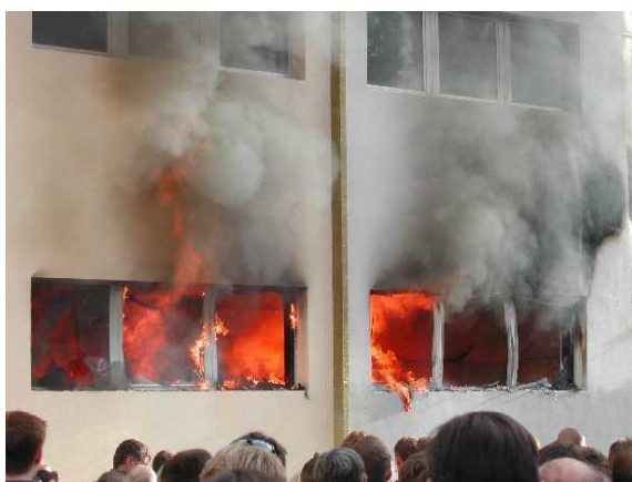
Fotografia: Teste de Incêndio em Fachada (após 27 minutos)